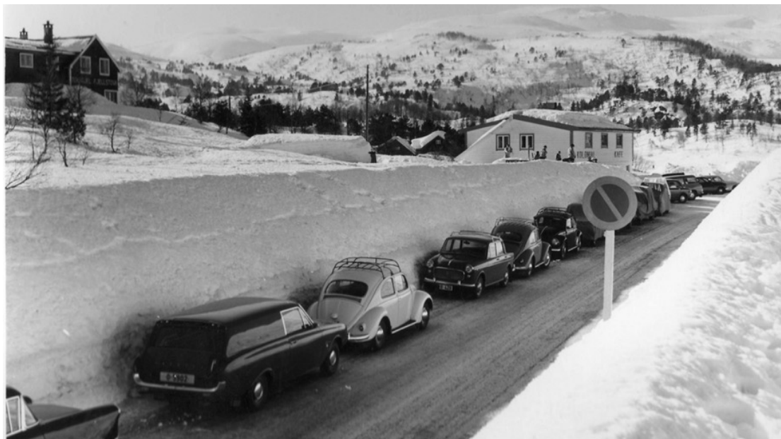
Bilkø Kvamskogen 1960