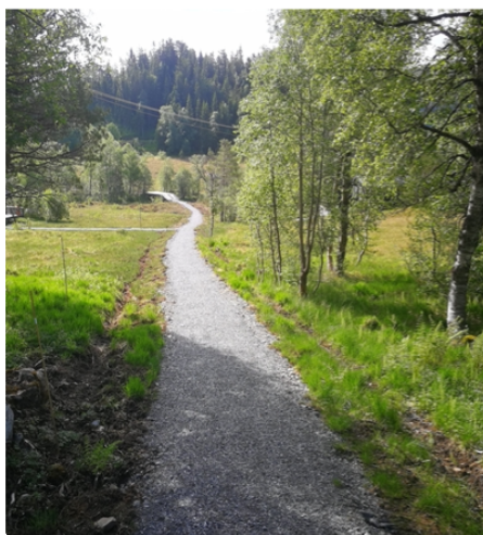
Sti fra Kvernsaskogen mot Skarbekken, bygget i 2020

Under ligger det noen bilder fra prosjektene som er ferdigstilt.