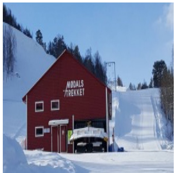
Mødalstrekket - bygget i 1963 og drives på dugnad