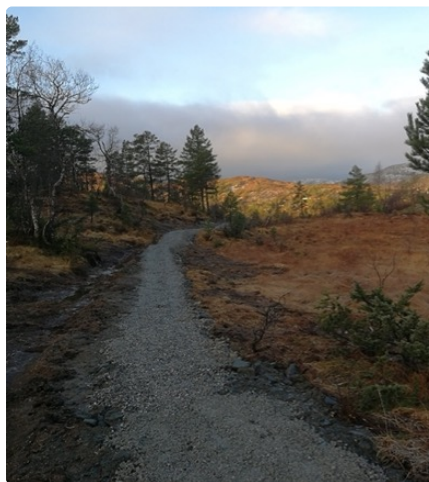
Fra Aktiven mot Kvinnhovden, bygget sti i 2020