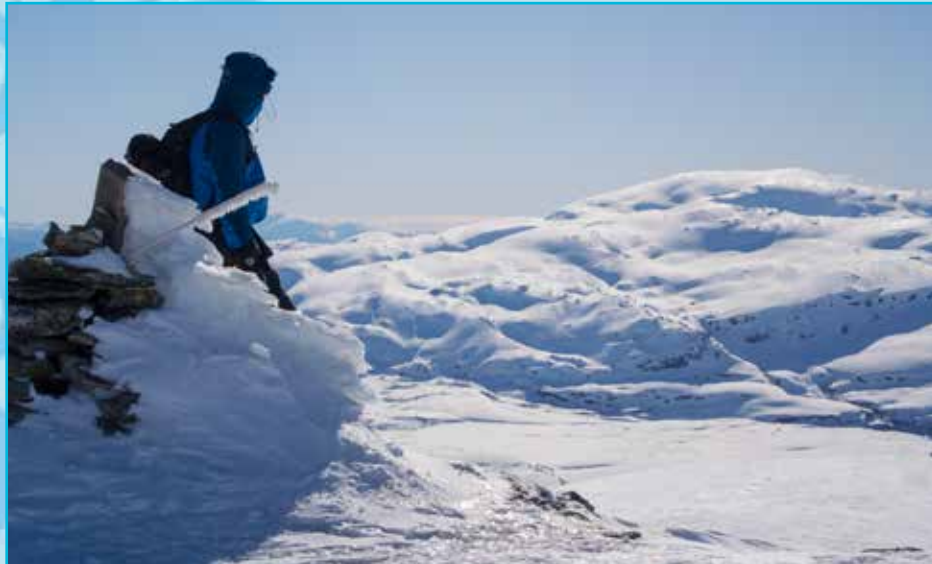
Utsikt frå Byrkjefjell mot Tveitakvitingen

Veteranen på Kvamskogen må vel seiest å vera Mødalstrekket . Dette trekket er ope frå 10.00-16.00 kvar laurdag og sundag samt i vinter- og påskeferien. Trekket kan vera start på skitur og den han tar deg opp i flott turterreng ved Mødalen. Her er det velpreparerte og familievenlege alpine løyper. Elles er her både varmestove med servering samt skiutleige.