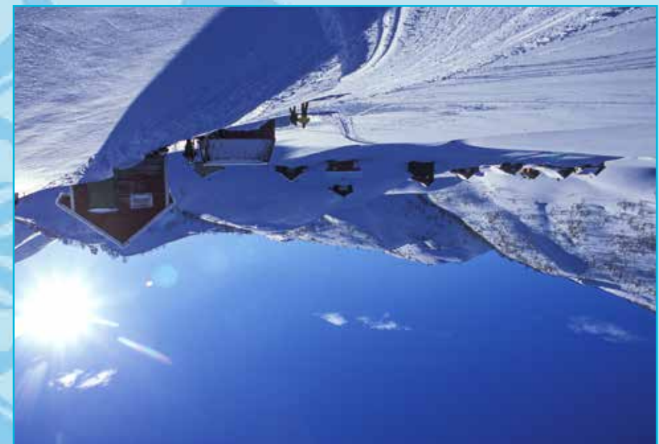
Ein av dei mest populære skiturane på Kvamskogen går via Mødal til Såta.

Allemannsretten er eit gæltis fellesgode. Retten er litta på omsynsfull framferd overfor grunneigarar, andre brukarar og respekt for naturmiljøet. Hugs å ta med deg alt søppel heim igjen, praktiser sporlaus ferdsle. ■ Hi alltid med kart, kompass og eventuelt GPS- og lær deg korleis du brukar det. ■ Kie deg etter forholda og hugs at veret kan vere urutsigbart. Ta alltid med ekstra tøy. ■ Det er forbod mot å ferdast i naturen med motorfartøytøy. ■ Ver varsam med eidd, hugs at det er generelt båtforbod i tida 15. april til 15. september. ■ Hund skal haldast i band der bulte beiter, det er generell bandvang mellom 1. april og 20. august. ■ Vile bær og sopp kan fritt plukkast. ■ Jakt og fiske i ferskvann og vassdrag inngår ikkje i allemannsretten. Retten ligg hja grunnneigarar, som må gje løyve. Fiskekort kan kjøpast lokalt. Det er lov å fiske med handsnøre. Gærtske er ulovleg, med få unntak. Før du byrjar å fiske må du selja deg inn i dei lokale fiskeglaene.